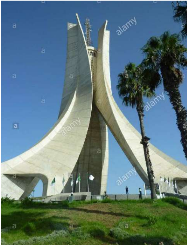
Ryad El Feth avec le musée de l'armée